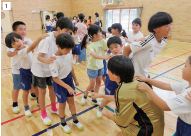
1 創立記念集会(じゃんけん列車) 2 田植え 3 6年生

学校教育目標： 自ら学び自ら考え 心豊かに人と関わる ことのできる たくましい児童の育成