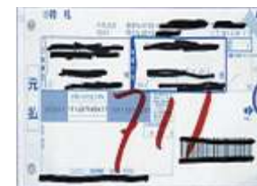
(宅配便の伝票など)