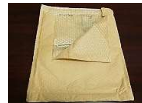
(通販用緩衝封筒など)