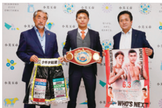
■ スポーツ推進課 スポーツ推進係 ☎ 0299-48-1111（内線2252）