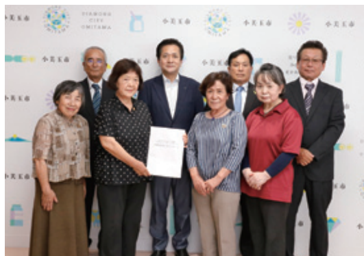
■ 社会福祉課 社会福祉係 ☎ 0299-48-1111（内線3225）

すべての国民が犯罪・非行の防止と立ち直りについて理解を深め、それぞれの立場で力を合わせて明るい地域社会を築くための全国的な運動です。