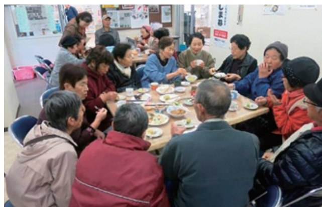
中野地区で行っている空き店舗を活用した「笑んがわ市」。産直コーナーと交流サロンを併せた、住民の憩いの場です。

各組織の活動内容は、イベント型から課題解決型へと変化。子どもたちが書く手紙を活用した高齢者の見守り活動や、買い物支援のために拠点施設を店舗化するなど、地縁でつながるあらゆる年代の人、企業、団体の力を結集し、地域のニーズをとらえた個性的な事業を行っています。