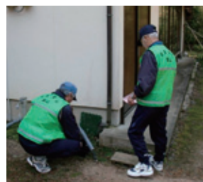
鍋山地区は水道検針を市から受託。各戸を訪問した際には声かけもしています。