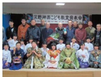
田井地区には神楽の伝統があり、子ども教室を通して次世代の担い手育成をしています。