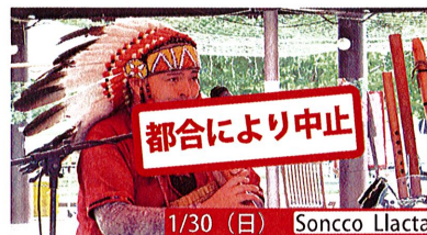
1/30 (日) Soncco Llacta