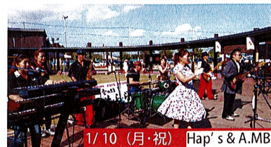
1/10 (月・祝) Hap's & A. MB