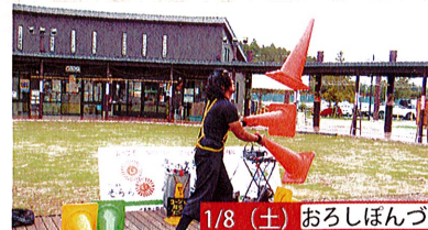
1/8 (土) おろしぼんづ

※この印のイベントは原則として雨天決行ですが、強風の場合は中止となりますので、HP等でご確認ください