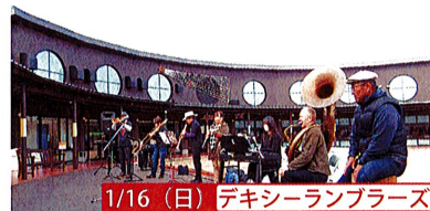
1/16 (日) デキシーランブラーズ