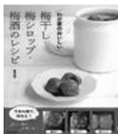
「わが家のおいしい梅干し・梅シロップ・梅酒のレシピ」 (柳澤由梨著/成美堂出版)