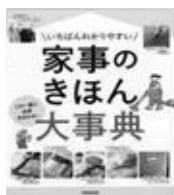
「いちばんわかりやすい 家事のきほん大事典」 ◀ (成美堂出版)

そんな衣替えのお悩みをお助けする本をご紹介します！ 図説があり分かりやすく収納テクニックを身につけられます。