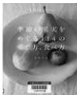
「季節の果実をめぐる 114の愛で方、食べ方」 (川田たま著/日本文芸社)

コロナ禍による在宅生活で料理をする機会が増えています。これを機に料理のスキルアップをしたい方や、旬の食材をこしらえる、丁寧な暮らしにあこがれる方におすすめの本をお届けします！