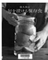
「堤人美の旬を漬ける保存食」 (堤人美著/NHK出版)