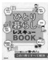
「ひとり暮らしレスキューBOOK」 (成美堂出版) ▶