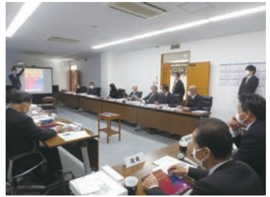
▲タブレット端末研修の様子（4/7 議会活性化特別委員会）▼

また、今後、執行部も含めて、議会のICT化を推進することで、さらなる会議の効率化や紙資料の削減が期待できます。