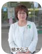
小美玉市公明党 (1名)

市民の負託に応えるため、地方行政等に関する諸制度、市政及び国・県政の動向等に関する広範かつ専門的な知識を得るため、これらに対する調査研究活動が必要となります。このため、議会においては、「委員会」活動とは別に、「会派」を中心に政策研究等の活動が行われることがあります。