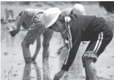
米づくりプロジェクト

自分たちの住む地域の良さや特色を知るとともに、協力してくださる方々との関わりから、教室ではできない勉強をたくさんしています。「米づくりプロジェクト」では、地域の方や保護者の方のご協力を得て、田植えや稲刈りを行っています。また、常陸小川ライオンズクラブの方やアサザ基金の方の協力を得て、霞ヶ浦の水をきれいにするために、「アサザプロジェクト」を20年以上続けています。4年生以上がアサザを植え付け、3年生以下がゴミ拾いを行っています。アサザは、思うように増えていませんが、少しでも自分たちの住む地区にある霞ヶ浦がきれいになるようにこれからも頑張ります。