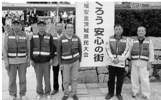
世楽パトロール隊の皆さま