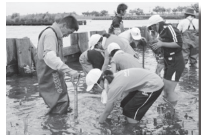
アサザプロジェクト