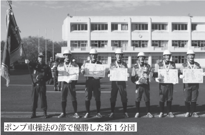
ポンプ車操法の部で優勝した第1分団

第 1 分団 ポンプ車操法の部 優 勝 第 1 0 分団 ポンプ車操法の部 第 3 位 第 1 9 分団 小型ポンプ操法の部 敢闘賞