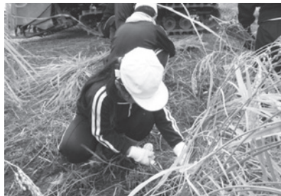
米づくりプロジェクト