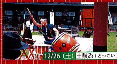
12/26 (土) 土鼓み(どっこい)