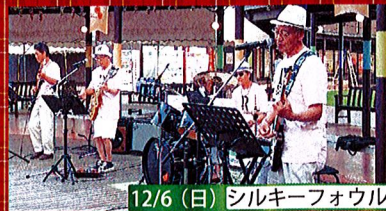
12/6 (日) シルキーフォウル

※この印のイベントは原則として雨天決行ですが、強風の場合は中止となりますので、HP等でご確認、またはお問合せください。