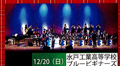
12/20 (日) 水戸工業高等学校ブルービギナーズ