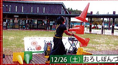
12/26 (土) おろしぼんづ