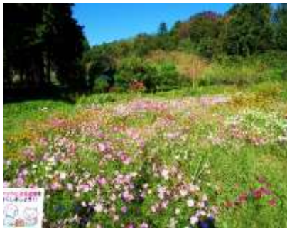
六井の一つ 玉井へ 今年植えた コスモス