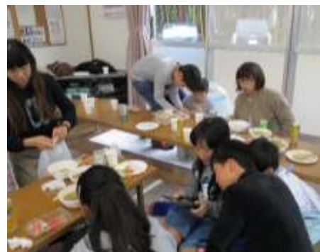
三世代交流会の風景