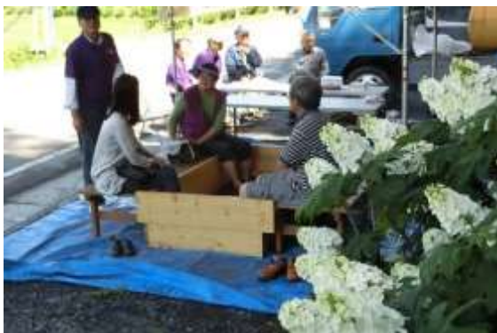
アジサイまつりの風景