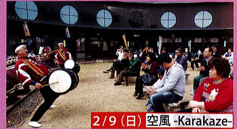
2/9 (日) 空風 -Karakaze-