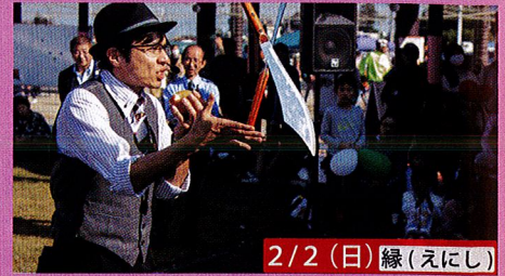
2/2 (日) 縁(えにし)