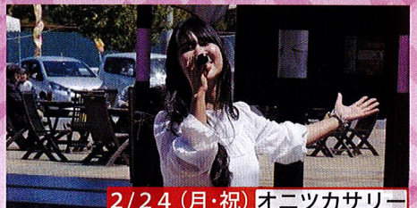
2/24 (月・祝) オニツカサリー