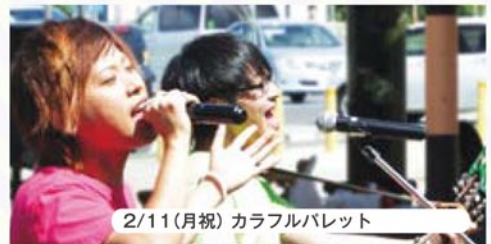
2/11(月祝) カラフルパレット