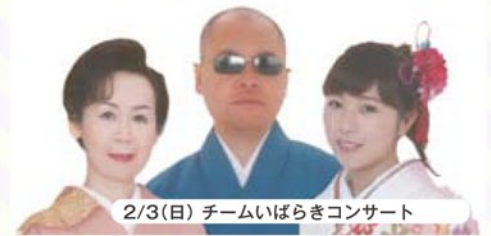
2/3(日) チームいばらきコンサート