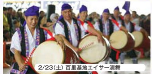
2/23(土) 百里基地エイサー演舞