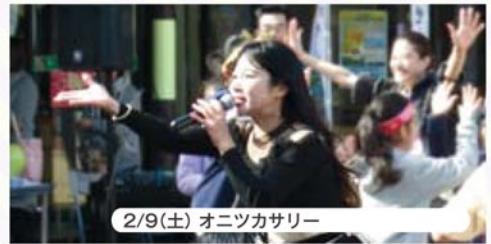
2/9(土) オニツカサリー