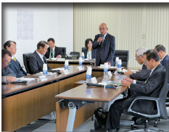
▲TX茨城空港延伸議会期成同盟会正副会長会議（小美玉市役所3F議会委員会室）