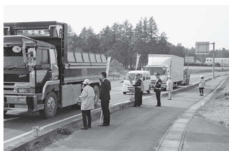
▲交通安全を呼びかける街頭キャンペーン

○この道路は通学路となっており、路線の一部(トヨペットから山川コミュニティセンター入口まで)は、本年度から歩道整備が計画されている。本交差点についても地域住民が安全に安心できる交差点になるよう検討していただきたい。