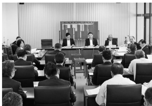
▲総務常任委員会の様子

A 設置場所については、犯罪の発生の恐れがある場所、小中学校周辺及び主要幹線交差点等にカメラの増設を予定している。また、今回は茨城国体に向けての安全強化の一環としての県事業で、国体の会場地へのアクセス道路沿いを中心に設置する。規格に関してはすべて同型のものを設置予定。