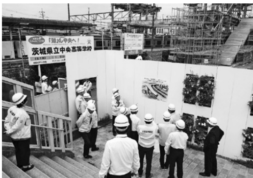
▲産業建設常任委員会の現地視察

が即時対応しているが、舗装の打換えなど業者に発注しなければならぬものは、状況にもよるが2〜3年かかる案件もある。