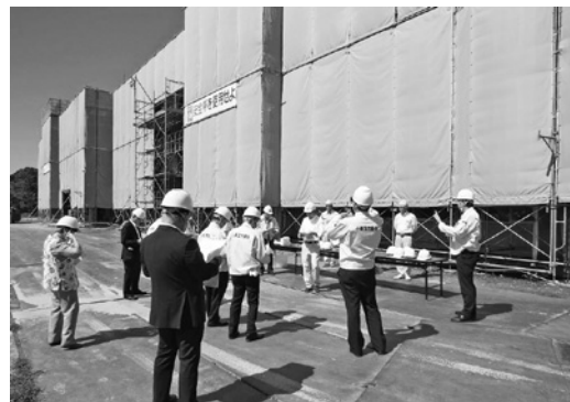
▲文教福祉常任委員会の現地視察

H29年度では、身体的なもの及び心身的なものを含めて相談件数25件、対応件数14件で近隣住民や警察、居宅介護支援事業所などからの通報により把握している。