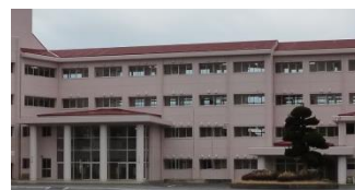
職員玄関 (写真右、樹木の裏手)

日 時 平成29年4月23日(日) 10時～14時(自由見学) 場 所 小川南中学校新校舎(小美玉市小川650番地) 持ち物 上靴 受付等 10時に来校される方: 職員玄関(駐車場から見て正面右寄り) 10時以降に来校される方: 職員室(職員玄関から校舎へ入り、 左へお進みください) 問合せ 小川南中学校 教頭まで 電話: 0299-58-2444 その他 廊下からの見学をお願いする部屋(普通教室等)もありますので、 ご了承ください。