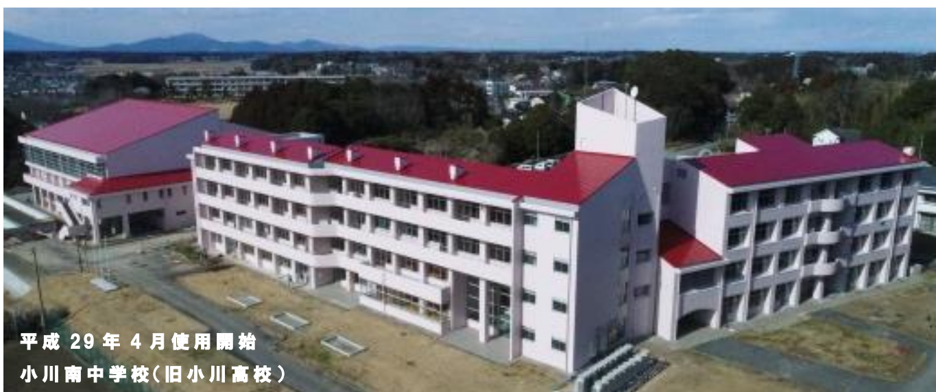
平成29年4月使用開始 小川南中学校(旧小川高校)