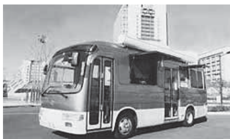
薬物乱用防止広報車「フレンド」号

また、フレンド号は県に1台しかないが、今年度は1校、昨年度は3校が活用している。今後は学校行事の日程調整等を行い、フレンド号を活用した薬物乱用防止教室が実施できるような努めたい。