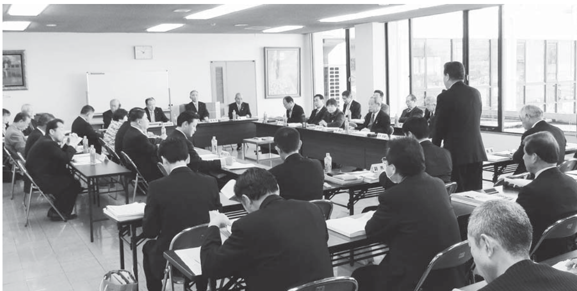
2日間にわたり、全議員出席のもと行われた予算特別委員会

その中で、3月10日、12日の2日間にわたり、27年度の当初予算（全10会計）を審査するため、予算特別委員会を設置し審査した。委員会での主な質疑応答の内容についてお知らせする。