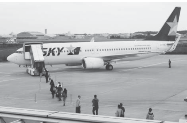
スカイマーク旅客機（茨城空港）

※そのほか、スカイマークシヨック（民事再生手続）、米軍再編交付金、公共ホールに関する質問があった。