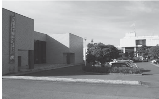
一括して耐震診断を発注する公共施設(美野里公民館と市役所本庁舎)

断を行い優先順位を決め計画的に取り組む。備品等貸し出しについても市民のニーズに合った備品の更新購入に計画的に努めていく。