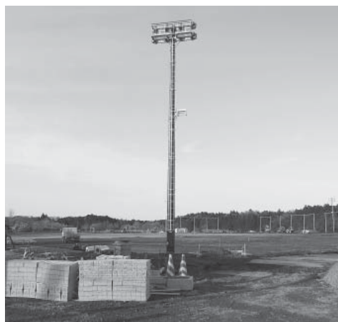
玉里運動公園 (4月9日撮影)

また、電気設備、園路整備、管理施設、駐車場の舗装は、東京電力との調整や設計図書の見直しなどから平成27年度に繰越し、5月ごろに完成の予定。さらに、多目的広場は、芝生舗装を行うため、芝生が根付くまでの初期管理が必要であり、8月末ごろに供用開始の予定。