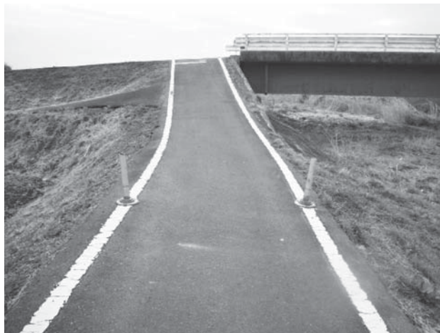
源道地橋と交差する箇所

②橋側の交差道路とのすりつけが急勾配であることは認識しているが、当時のみのりロード整備の考え方が、あくまでも現道での整備であったことから、整備前の現状勾配に基づく施工結果と伺って