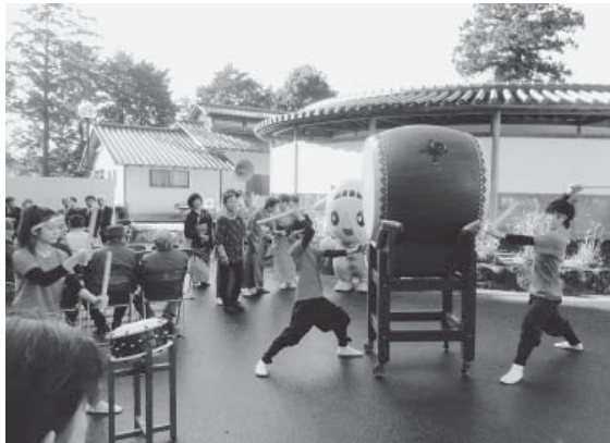
昨年11月に実施された「やすらぎの里まつり」

A. 当施設は、7月3日に20周年を迎える。毎年、秋に「やすらぎの里まつり」を開催してきたが、現在、当施設は、敷地が整備され、春から夏にかけて梅や桜、紫陽花、百合などが次々に開花する。施設のアピールができるこの時期に合わせて、記念事業を開催したいと考えている。具体的内容は、今後、実行委員会で協議する。