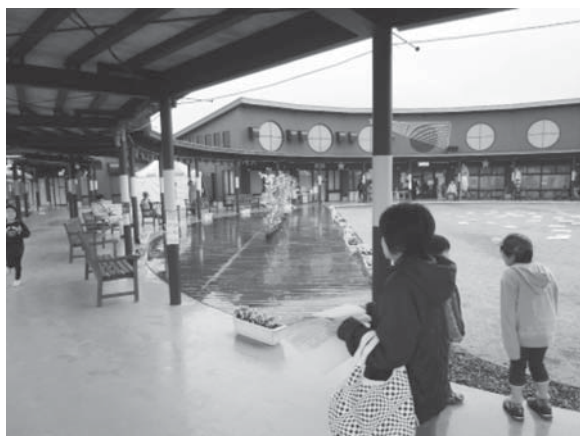
空のえき「そ・ら・ら」

将来的には、空港を生かしたまちづくりの1つとして空のえき「そ・ら・ら」の発展に全力を尽くしていきたいと考えているが、若手職員を中心としたワーキングチームによる独自の施策の検討や市職員提案制度を活用し、茨城空港周辺事業に特化したアイデア募集も検討していきたい。また、平成26年度に策定した「農村活性化施設基本構想」では、空のえき周辺エリアに収穫体験及び栽培実証農園を整備し、さらに空のえきを拠点とした総合交流型体験ゾーンを展開することなどを盛り込んでいく。