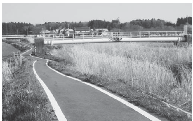
亀裂が見られる箇所（小岩戸地内）

③市道の雑草管理については、幹線市道を優先的に実施しており、全ての市道までは予算面、人員面とも対応できない現状にある。特に、不特定多数の方が利用されていない市道の場合、危険箇所の補修以外の管理は、極力地元の皆様方にご協力をいただいている状況なので、ご理解とご協力をお願い