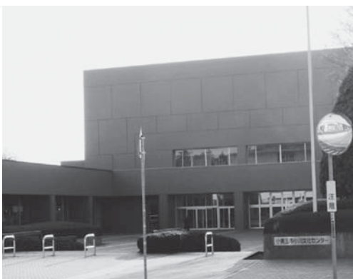
小川文化センター「アピオス」

は、23年度より指定管理者による運営を行っているが、施設の管理運営上の課題や問題点を洗い出し、サービス向上と経費の節減に取り組んでいきたい。また、四季健康館とことぶきの温浴施設は、管理コストの変化や利用者数の動向を踏まえ、利用料金の適正化に努めていきたい。