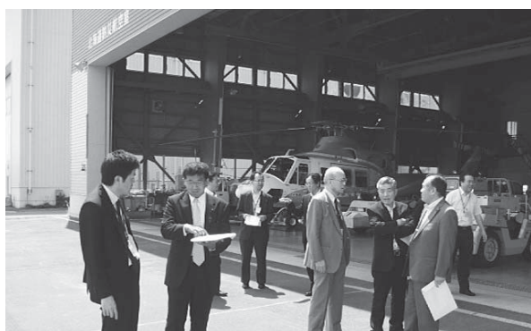
産業建設、百里基地・茨城空港対策特別委員会 合同の管外視察（H24.7 札幌丘珠空港にて）

A. 産業経済部長 臨空型産業振興などへのアプローチや整備格納庫等の関連施設等の環境整備などについて、誘致を行ううえで有効な選択肢の1つと考える。市としては、県や関連する機関に対し働きかけていきたい。