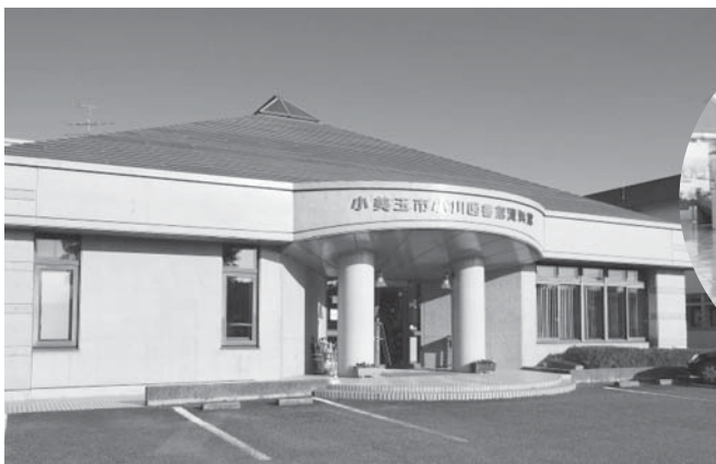
2階が資料館となっている「小川図書館・資料館」

また、このような状況の中、新年度から公共施設等の全体を把握し、長期的な視点で更新、統廃合、長寿命化などを計画的に行うことにより、行財政負担の軽減等を図るために「小美玉市公共施設等総合管理計画」の策定に取り組むことや、小中学校の適正規模配置に関する答申において、「学校施設の跡地・跡施設利用に関して調査・研究を行うとともに、地域住民と連携しながら検討を進められたい」