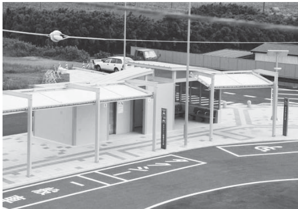
小川駅のトイレと待合室

A 現在は職員の見回りと業者への委託で対応している。今後は地域の方々のご意見をいただきながら、市民協働の形を模索していきたい。