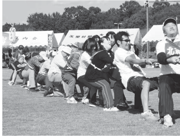
昨年の市民体育祭