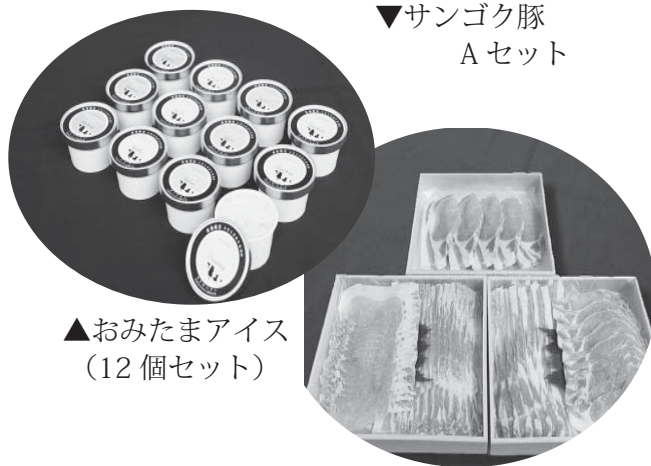
▲おみたまアイス (12個セット)