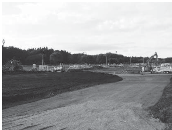
拡張工事が始まった美野里霊園

A 旧霊園の1687区画のうち今年度残っていた7区画を売り完売しているが、一旦利用して戻ってきた6区画だけが残っている。