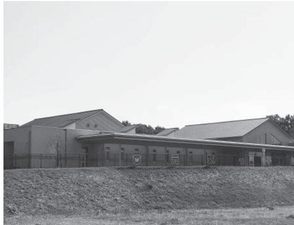
預かり保育を実施している元気っ子幼稚園

A 現在は、玉里幼稚園と元気っ子幼稚園で実施している。今回の耐震補強工事により、美野里地区の幼稚園でも預かり保育を実施できると考えている。