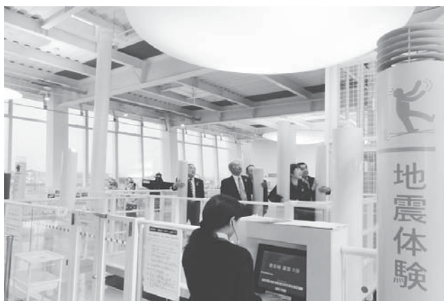
千歳市防災学習交流センター「そなえ〜る」にて

敷地(約8.4ha)には3つのゾーンがあり、防災学習交流センター(3階建て)のあるAゾーンには、防災訓練広場、備蓄倉庫を兼ねた副訓練塔、常設ヘリポート等を配置。Bゾーンには、1.1haの広さの「学びの広場」、Cゾーンには、約150人がキャンプに利用できる野営生活訓練広場、調整池を備えた多目的広場、湧き水を利用した河川災害訓練広場、土のう訓練広場、アスレチック遊具などを設置したサバイバル訓練広場のほか