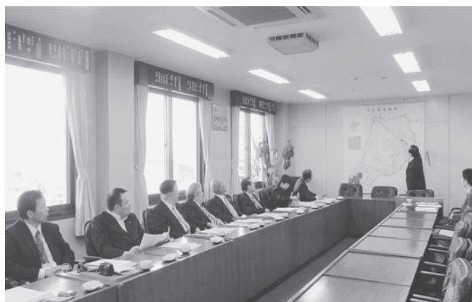
北広島市役所にて

北広島市議会のインターネット中継は平成20年4月に、議会運営委員会から検討の声が上がり、広報委員会が調査が開始され、平成23年6月定例会から導入となった。導入経費が安価であり、市民が自由な時間に議員の姿を見て、声が聞けること等により、利用者からは大変好評で、議会を知ってもらうには非常に有効な手段であると感じた。