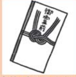
秘書等が代理で出席する場合の葬式の香典