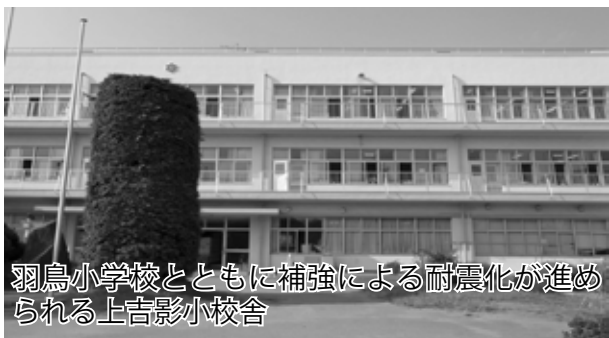
羽鳥小学校とともに補強による耐震化が進められる上吉影小校舎