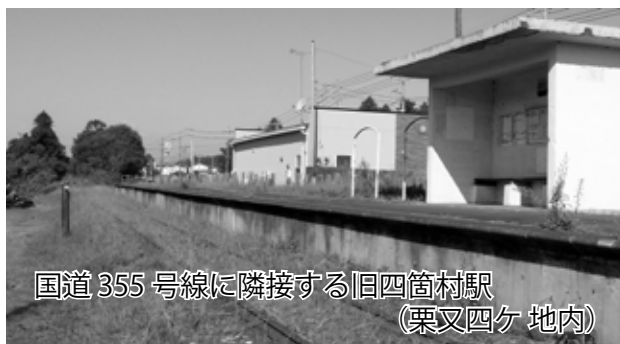
国道355号線に隣接する旧四箇村駅(栗又四ヶ地内)