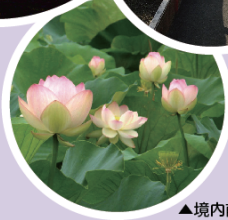
▲境内前からの風景