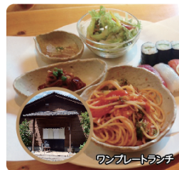
ワンプレートランチ

知人ぞ知る隠れ家風のお店です。お寿司以外にも和洋問わず旬の食材を使った料理を、自然に囲まれた落ち着いた店内で楽しめます。お寿司とパスタのコンビ! ワンプレートランチがおすすめ。