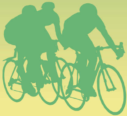
Omitama Guide Map