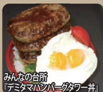
みんなの台所「デミタマハンバーグタワー丼」

毎月第2日曜日は、月に一度のデカ盛りday ・今月は4月9日(日) 普段食べられない大きさを一人で、みんなで、楽しもう! (数量限定)