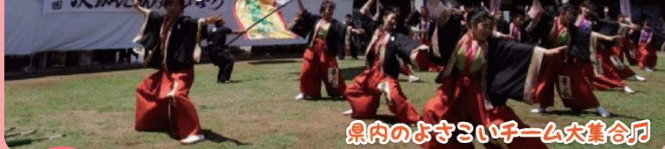
県内のよさこいチーム大集合!