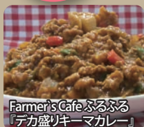
Farmer's Cafe ぶるぶる「デカ盛りキーマカレー」