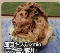
産直キッチンmio「デカ盛り豚丼」