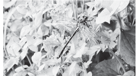
ヤマサナエ(サナエトンボ科)