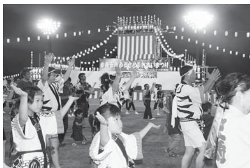
昨年の豊年踊り大会の様子