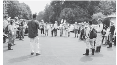
平成22年 開会式の様子