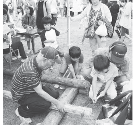
まちづくり活動の一例 ふれあい広場(羽鳥コミュニティ)

「まちづくりの主役は住民一人ひとり!!自分の住むまちを自らが参加してより良くしていこう」そんな願いを込めて、今年で第7回となるふるさと塾は『市民参加のまちづくり』を担う人材の育成を目指します。まちづくりに興味をお持ちの方ならどなたでも入塾できます。あなたも、ふるさと塾の塾生になって、まちづくりに参加してみませんか?