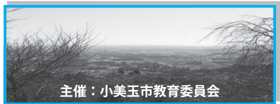
主催：小美玉市教育委員会