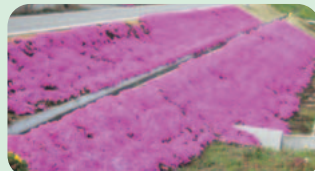
竹原の農道沿いにひろがったシバザクラ (19日撮影)