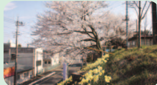
玉川地区学習等供用施設付近の桜と水仙 (9日撮影)