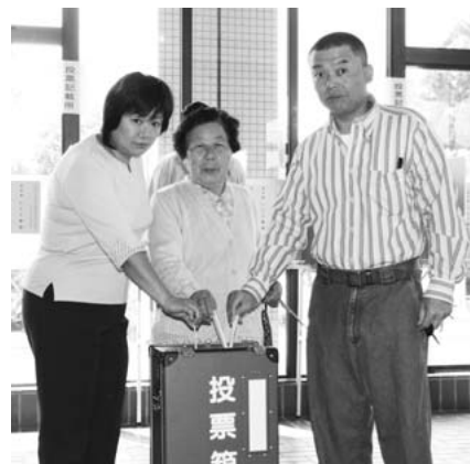
第37投票区（玉里総合支所）