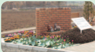
佐才の広域農道沿いにチューリップやパンジーなどが咲いているかわいらしい花壇 (19日撮影)