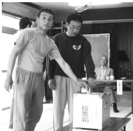
第27投票区（上合公民館）