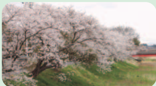
園部川沿いの桜並木 (9日撮影)