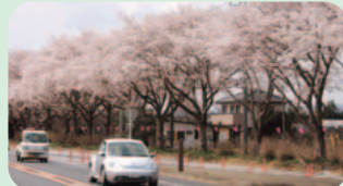
国道6号沿いの桜並木 (9日撮影)