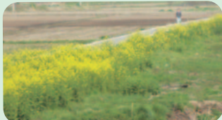
巴川のみのリロード沿いに咲く菜の花 (19日撮影)