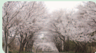
幡谷の桜並木 (9日撮影)