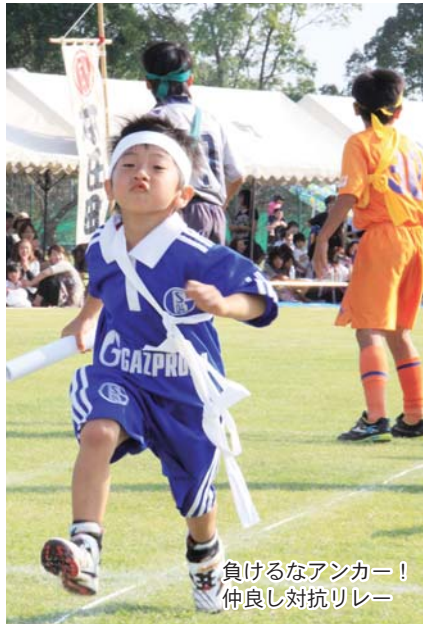
負けるなアンカー！ 仲よし対抗リレー