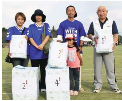
▲全員参加の〇×クイズで 見事勝ち残り、賞品獲得!