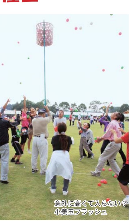
意外に高く入らない？ 小美玉フラッシュ