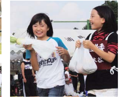
▲大根ゲットしました♪ 野菜つかみ競争