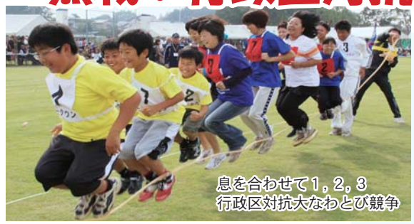
息を合わせて1, 2, 3 行政区対抗大なわとび競争