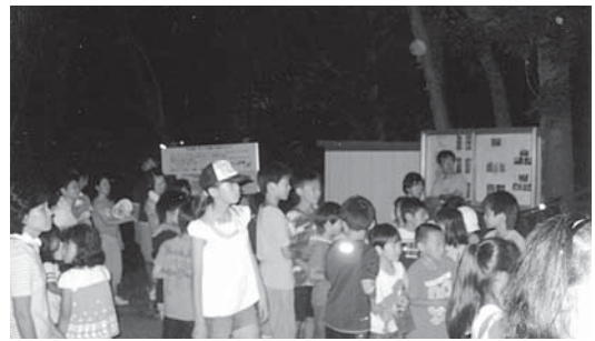
ヘイケボタル鑑賞会の様子

また、併設の子どもわくわくクラブは、「ホトメの里」を拠点として、将来を担う子どもたちに自然の中での遊び、観察、体験活動等の支援をしています。