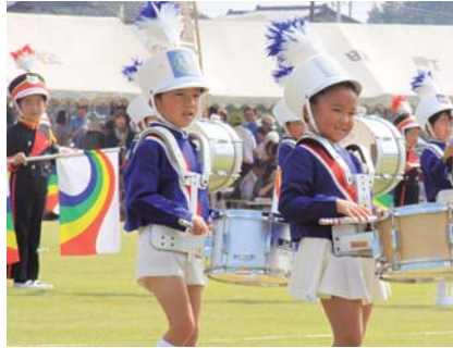
◀園児によるマーチングバンド