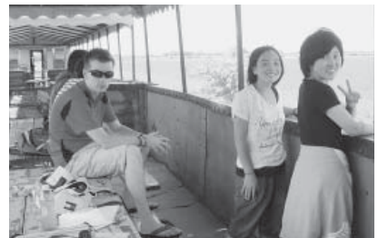
エクスカーション・トレインにて

I hope you all enjoyed reading about our adventures in Kansas, and I hope that you will all consider going with us in 2013. It was so much fun and we would love to share it with you! Talk to you again soon!