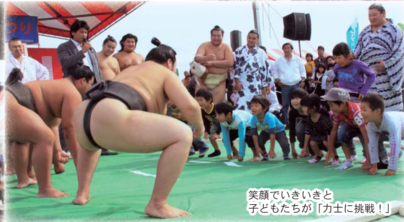
笑顔でいきいきと 子どもたちが「力士に挑戦！」

〈編集・発行〉小美玉市役所秘書広聴課 ☎ 0299-48-1111 内線 1221