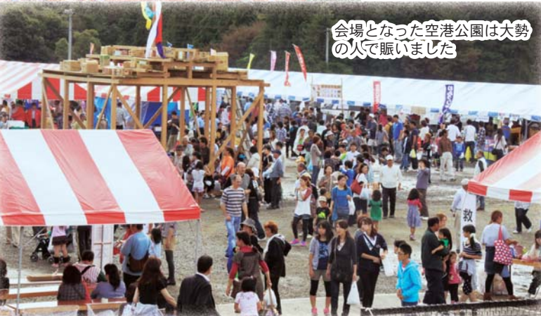
会場となった空港公園は大勢 の人で賑いました