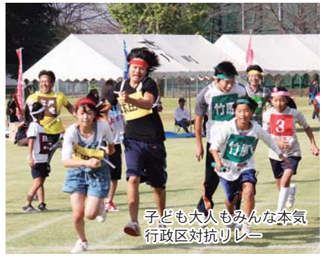
子ども大人もみんな本気 行政区対抗リレー

ました。 今年から新たに追加された「小学 校区対抗つな引き」では、幅広い年 代からの参加があり、また小学校区 単位で行われたことにより、多くの 方が交流を深め、絆を強めることが できたようです。 行政区対抗種目では二本松区が優 勝し、見事6連覇を成し遂げました。