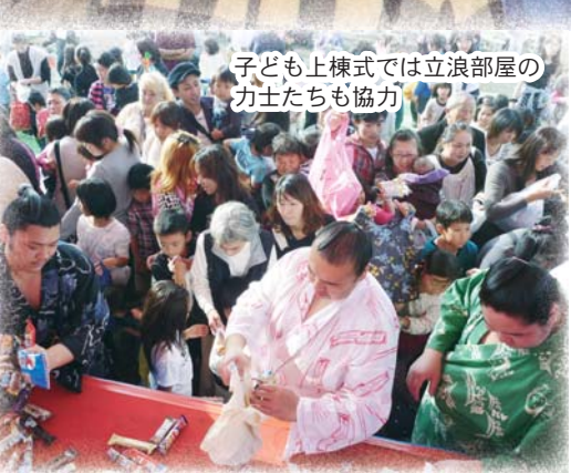
子ども上棟式では立浪部屋の 力士たちも協力

10月23日、茨城空港公園を会場に「2011おみたま産業まつり」が開催されました。 会場は60もの企業・団体による出店で賑わい、中央のイベント広場では立浪部屋による相撲イベント、エイサー太鼓の演舞などが披露され、来場者の皆さんはとても楽しんでいました。 今年も来場者数は1万人を超え、午前午後の2回にわたり行われた上棟式&子ども上棟式にはたくさんの人だかりができ、まつりを大きく盛り上げました。