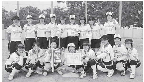
美野里ビサイレンツのみなさん 大会優勝で喜びのVサイン

【問い合わせ】美野里ビサイレンツ 事務局 榎ミノリテック内 木内 ☎：48-3400