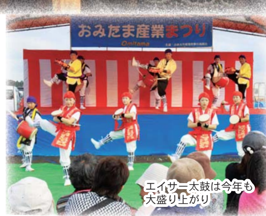
エイサー太鼓は今年も 大盛り上がり

10月23日、茨城空港公園を会場に「2011おみたま産業まつり」が開催されました。 会場は60もの企業・団体による出店で賑わい、中央のイベント広場では立浪部屋による相撲イベント、エイサー太鼓の演舞などが披露され、来場者の皆さんはとても楽しんでいました。 今年も来場者数は1万人を超え、午前午後の2回にわたり行われた上棟式&子ども上棟式にはたくさんの人だかりができ、まつりを大きく盛り上げました。