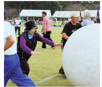
▲仲良く大玉ころがし