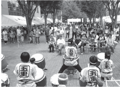
地域交流まつり風景

玉里小学校区コミュニティは、旧玉里村の7行政区と地域の諸組織で構成されています。私たちは一致協力して、地域交流まつり、世代間交流球技大会、合同敬老会等の事業を催し、明るく楽しい地域交流づくりに努めています。