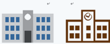
小川南中 ——— 統合小