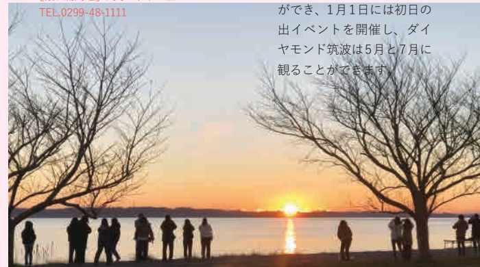
初日の出イベント：1月1日、ダイヤモンド筑波：5月中旬・7月下旬

霞ヶ浦周辺では季節によって様々な景色を楽しむことができ、1月1日には初日の出イベントを開催し、ダイヤモンド筑波は5月と7月に観ることができます。