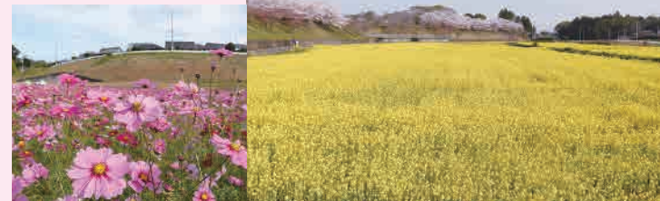
菜の花：4月上旬～5月上旬、コスモス：9月下旬～10月下旬

希望ヶ丘公園周辺と霞ヶ浦湖岸沿いでは季節の花（菜の花・コスモス）が咲き誇ります。小美玉市の風物詩のひとつとして親しまれています。