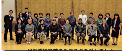
※写真撮影時のみマスクを外しました

久しぶりにアピオスに集めたぱるすの皆さん♪まだまだコロナ禍ではありますが、少しずつ前を向いて進んでいるという気持ちが、集まった皆さんの笑顔に表れていました。