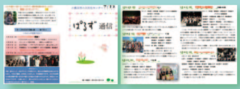
2013年3月発行の第1号・・・発行当初はA4横両面4ページで作成(6号まで)